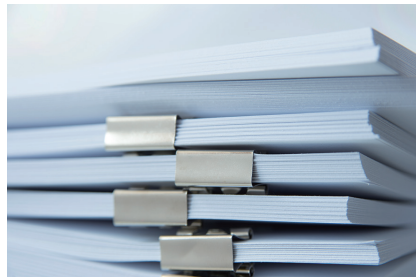
受検者(従業)マスタの準備