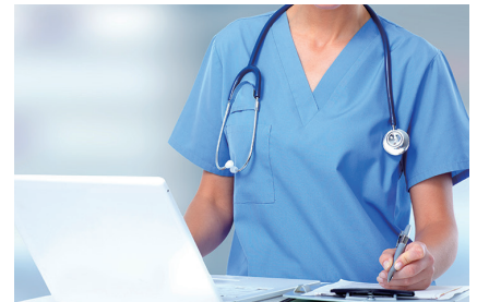
実施者(産業保険医)との連携