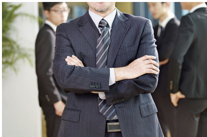
社内の従事者(担当者)を決定